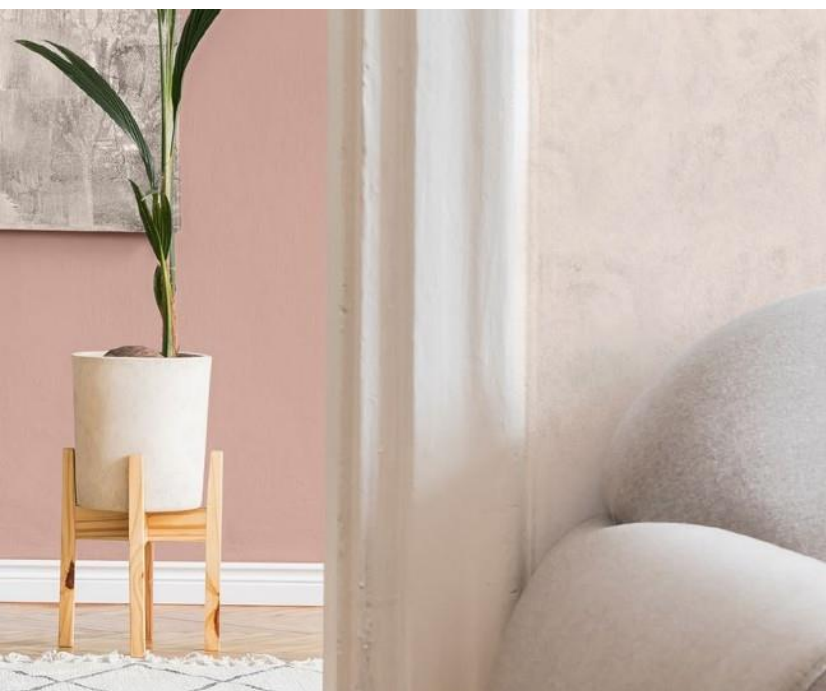
MARMORINO KS, CALCECRUDA