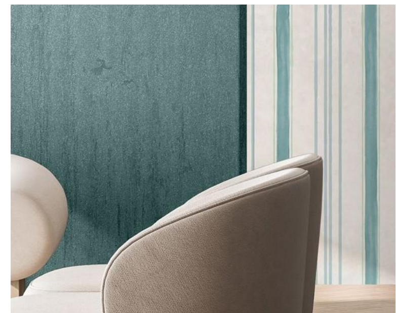
MALOVÁNÍ NA SVĚTLÉ STĚNY, TAPETY