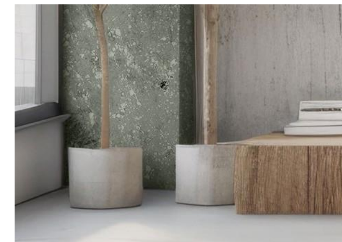
OBLOUKY+ KÁMEN, STĚNA2PODLAHA