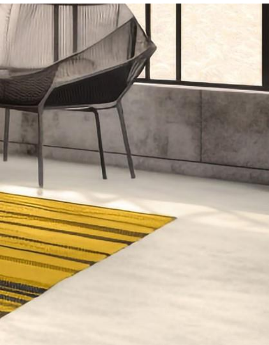
ARCHI+ BETON, WALL2FLOOR