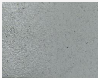
W2F POLVERE 20214 & CF SATIN