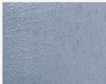
W2F POLVERE 20216 & CF SATIN