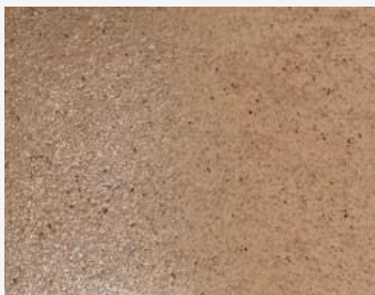
W2F POLVERE 20201 & CF LESKLÝ