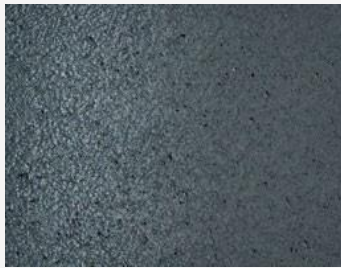
W2F POLVERE 20209 & CF SATIN