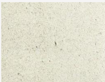
W2F POLVERE 20204 & CF PULT ULTRA MATNÝ