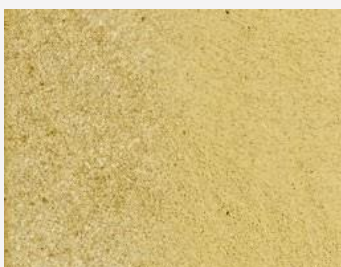
W2F POLVERE 20203 & CF DESKA SATÉNOVÁ