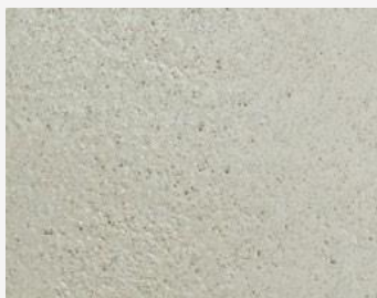
W2F POLVERE 20211 & CF SATIN