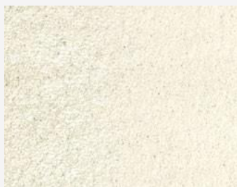
W2F POLVERE 20206 & CF SATIN