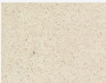
W2F POLVERE 20202 & CF MATT