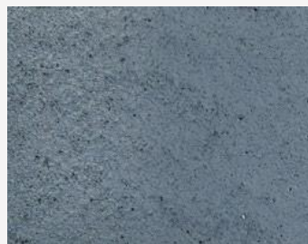
W2F POLVERE 20215 & CF SATIN