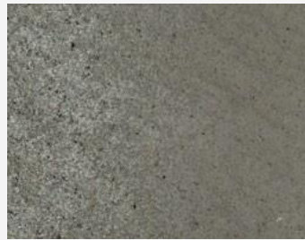
W2F POLVERE 20213 & CF SATIN