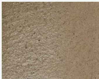
W2F POLVERE 20205 & CF SATIN