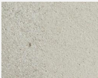
W2F POLVERE 20210 & CF SATIN