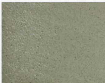
W2F POLVERE 20212 & CF SATIN